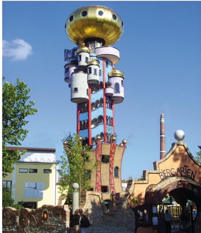
Kuchlbauer Turm – ein Hundertwasser Architekturprojekt, geplant und bearbeitet von Architekt Peter Pelikan (C) Gruener Janura AG, Glarus, Schweiz · (C) Foto: Brauerei zum Kuchlbauer GmbH & Co. KG

Mit der statischen Berechnung des Turmes wurde das Ingenieurbüro Uhrmacher beauftragt, welches das bekannte Planer-Portal www.diestatiker.de betreibt. Bei der Berechnung der Struktur setzte das Büro auf Software aus dem Hause Dlubal. Die aus 508 Stahlstäben bestehende Tragkonstruktion der Dachkugel wurde mit RSTAB berechnet. Sie hat einen Durchmesser von 10m. Das Gesamtgewicht der Dachkugel inklusive Verkleidung beträgt zwölf Tonnen. Bei der Ausführung des Turmes wurden ca. 140 t Betonstahl und ca. 15 t Profilstahl verbaut.