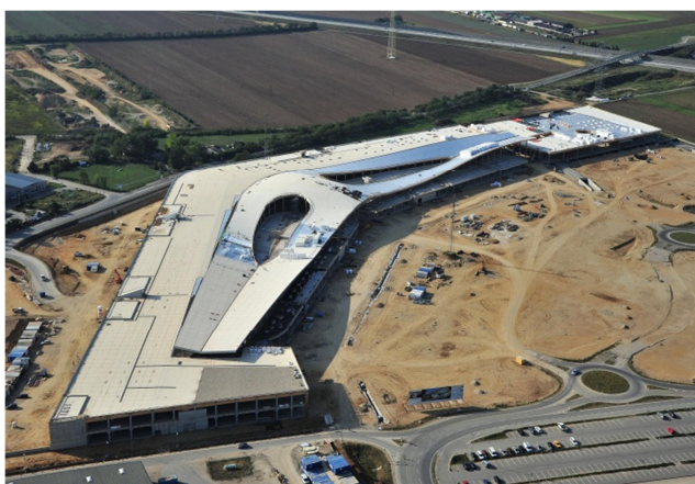
Luftbild des Shopping Resort Gerasdorf im Bauzustand