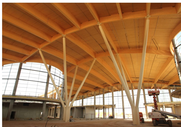
Innenansicht der Dachkonstruktion aus Holz