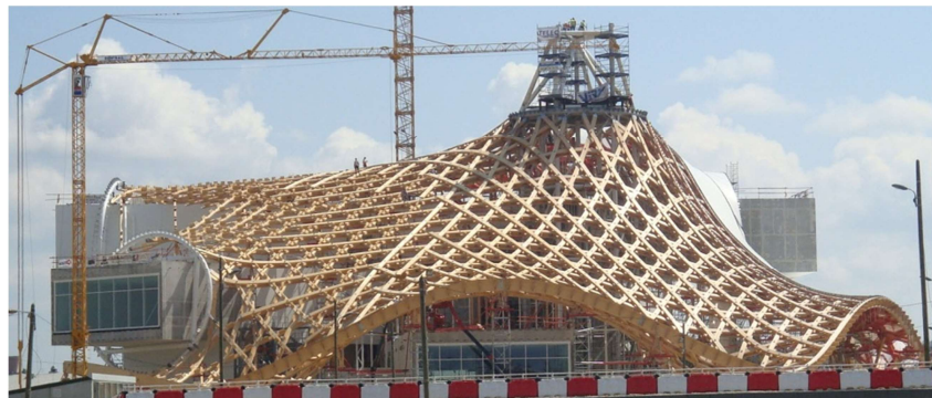
Rohbau des Centre Georges Pompidou-Metz

Dieses komplexe System aus ca. 41.000 Stäben mit Hilfe von RSTAB und den Dlubal-Zusatzmodulen HOLZ, DYNAM und RSKNICK zu bemessen, war Aufgabe der Fa. SJB.Kemptoner.Fitze AG. Dabei wurde die Unterkonstruktion in Stahl und Stahlbeton komplett mit einem „vereinfachten“ System be-