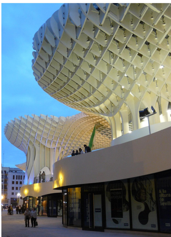
Metropol Parasol in Sevilla