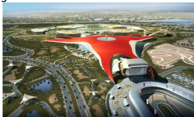
3D-Visualisierung des Ferrari World Theme Parks (Benoy Architects)

Der Ferrari World Theme Park wird von einem riesigen Dach überdeckt. Die komplette Dachkonstruktion mit einer Oberfläche von ca. 195.000 m 2 besteht aus einem MERO Raumfachwerk. Mit einer Gesamtanzahl von ca. 170.000 Stäben und ca. 42.200 Knoten ist es das größte je gebaute Raumfachwerk.